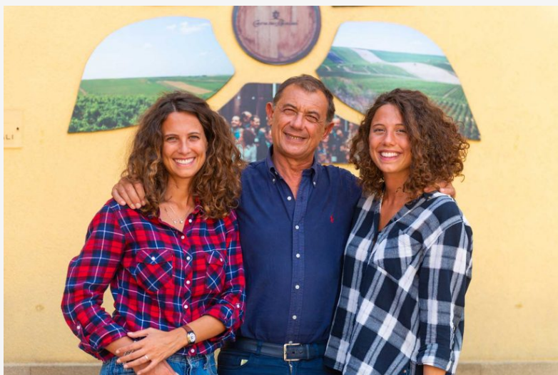
Tanta Italia nella Top 100 Best Buys di Wine Enthusiast