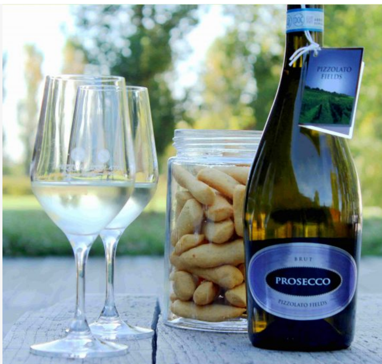
Tanta Italia nella Top 100 Best Buys di Wine Enthusiast