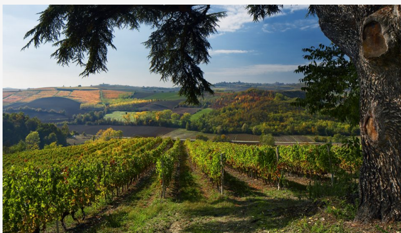
Tanta Italia nella Top 100 Best Buys di Wine Enthusiast