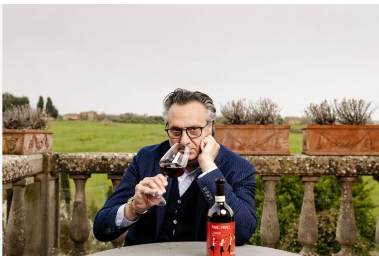
Tanta Italia nella Top 100 Best Buys di Wine Enthusiast