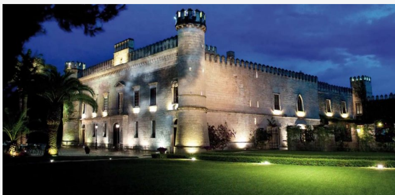
Tanta Italia nella Top 100 Best Buys di Wine Enthusiast