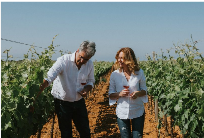
Tanta Italia nella Top 100 Best Buys di Wine Enthusiast